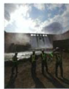
若者たち(土木技術伝承のかたち) 鈴木 篤