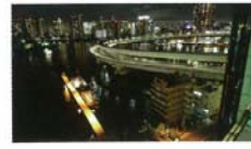
虹と大地を結ぶ環 櫻井 純