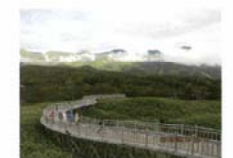
知床の遊歩道 杉浦 俊雄