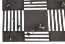
踏みしめる 宮地 健太郎