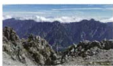
立山から望むくろよんダム 豊田 絵里香