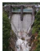
仙人谷ダム 望月 信吾