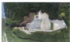
重機の砂場 澤井 茂