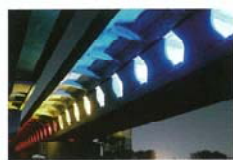
カラフルに浮び上がるバタフライウェブ橋 三宅 悟