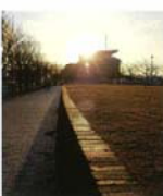
散歩道～門司 湯村 秀行