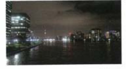
雲と川に反射する光 吉井 宏治