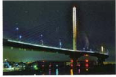
ハープ橋の美 小池 基夫