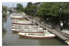
柳川川下り 森 幹恵