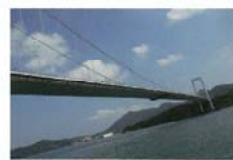
大島大橋 花坂 弘之