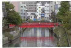
町の人々の暮らしを支えてきた木場の新田橋 土屋 敏明