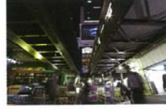
90年の歴史 宮地 健太郎