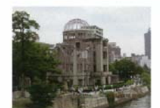
原爆ドームと遊歩道(河川管理道路) 杉浦 俊雄