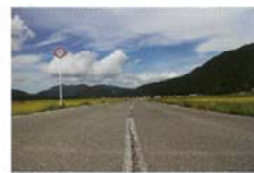
道にも人生がある 豊田 裕美恵