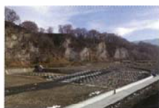
天然記念物 十三崖と魚道工 上原 康樹