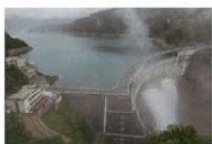
黒部ダム 望月 信吾