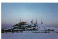
黎明の空 三角 亜樹子