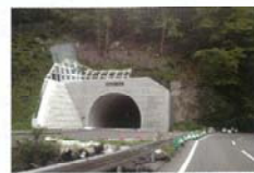
建設進む国道45号線 高田 守康