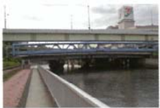
遊歩道のある運河に架かる首都高と水管橋 土屋 敏明