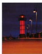
暮れの赤灯台 野口 史温