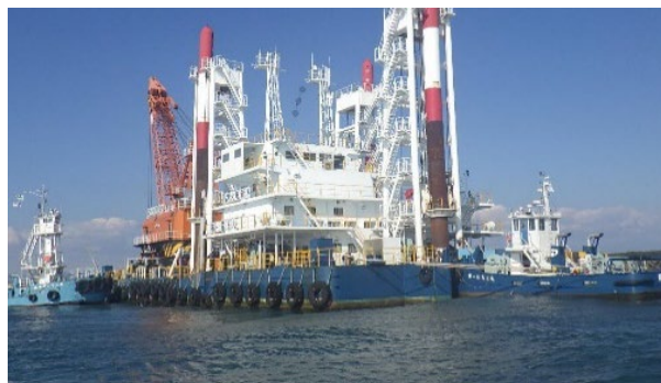
【グラブ浚渫船（スパッド式）】