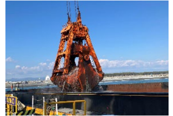
【浚渫作業② 土砂積込】