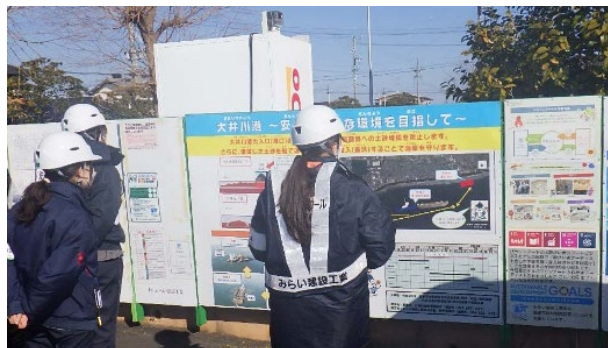
【大井川港航路（港口部）埋設対策ほか浚渫工事説明看板】

1月21日（火）中部支店 大井川作業所において、レディースパトロールを実施しました。当日は、グラブ浚渫船へ乗船し、ICT施工、DX化など現場で取り組んでいる働き方改革、安全対策、環境に配慮した取り組み等を確認してきました。グラブ浚渫船のオペレーションルーム内で、熟練オペレーター（船長）のお話を伺うことができ、浚渫オペレーションは技術力と経験が無くしては、ICT技術を活かせないことを学び、参加した女性職員にとっても意義のあるパトロールになりました。