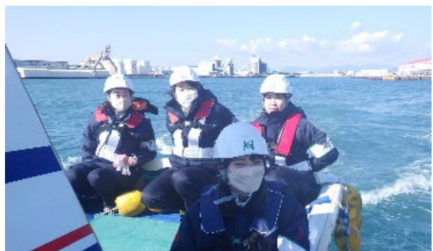
【グラブ浚渫船へ通船で移動】