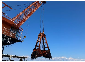
【浚渫作業① 土砂採取】