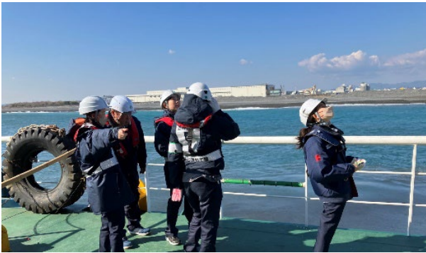
【グラブ浚渫作業確認中①】