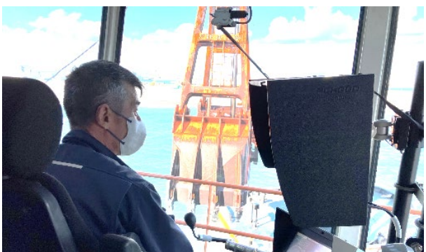
【オペレーションルーム 浚渫土採取中】

船上には男女別の快適なトイレ、休憩室が設置されるなど働く環境に配慮されていました。