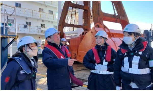
【グラブ浚渫作業説明】