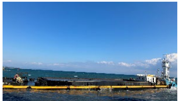
【土砂運搬船で土砂の海上運搬】