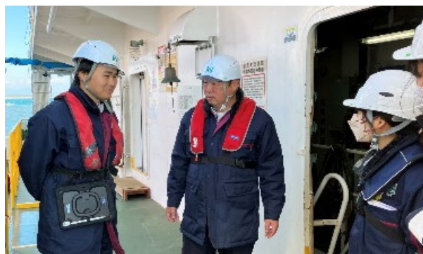
【若手職員からの船上説明】